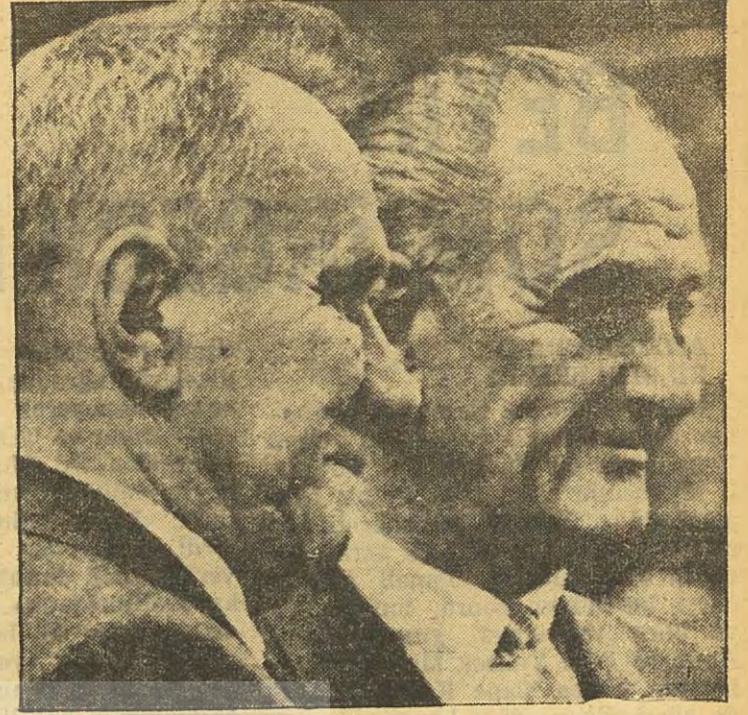
Kosigin — Johnson Kural, tek taraflı işleme!

Yarı tekelci bir dünyaya girmiş bulunuyoruz. Bu dünya'da, öteki devletlerden çok üstün iki devlet vardır. Ama iki büyükler arasında da eşitsizlik çok geniştir. Bu sebeple, ancak tek bir süper büyük vardır. Bununla beraber, ikinci büyük de, birincinin kevfince hareket etmesini engelliyecek kadar kud-