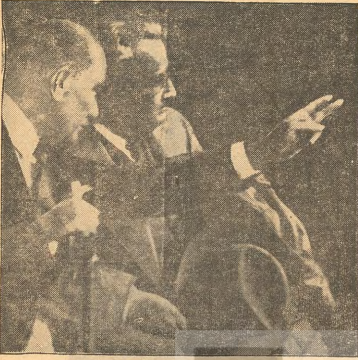
Atatürk ve Yunus Nâdi «Bizim sermayemiz emektir.»