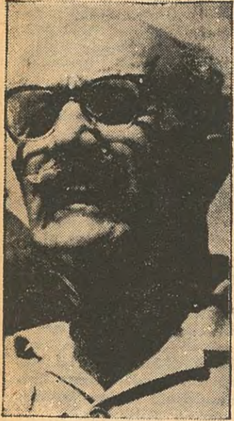
General Grivas Darbe mi?..

Faşist askeri cunta ile Makarios yönetiminin arası gittikçe açılıyor gibidir. Sansür altındaki Atina basınından Makarios rejimine yöneltilen tehditkâr eleştiriler, anlaşmazlığın iyice genişlediğini göstermektedir. Atina cuntacıları, Adada Enosis'çi faşist Grivas'a dayanmaktadır. Hattâ Grivas'ın bir darbe ile Makarios'u devirip bir oldu - bitti ile Enosis'i gerçekleştirilmeyi öteden beri tasarladığı bilinmektedir. Makarios ise, Atina darbesinden beri gittikçe Enosis'ten uzaklaşmaktadır. Çeklerden sonra Sovyetlerin de Makarios'a 28 milyon dolarlık silah vermeyi kararlaştırdıkları haberi eğer doğruysa, bu, Enosis'çi Grivas'a ve Atina darbecilerine karşı Makarios rejimini koruma endişesinin sonucu olsa gerektir.