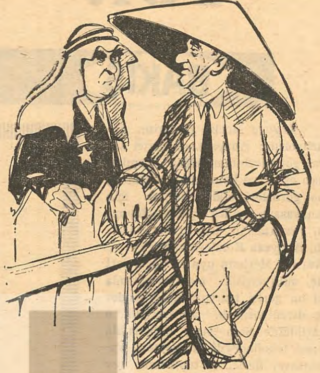
ARAP KOSIGIN — İSRAİLLİ JOHNSON

Birinci Beş Yıllık Plânın nasıl bir ilgi ve heyecan yarattığı hatırlanmalıdır. Bu plân hakkında dergiler dolu sayılar yazılmıştır. Halbuki İkinci Beş Yıllık Plân tam bir ilgisizlik içinde Meclisler-