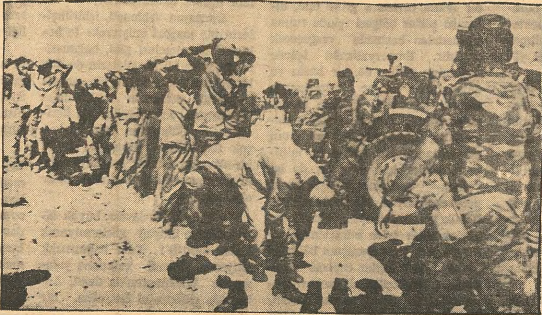
Arap - İsrail savaşından bir görünüş Sonuç: Mısırın aşırı sola kayışı!..

Vietnam'da Kuzeyin bombardımanını dahi durdurmaya yanaşmayan bir ABD karşısında, başta Tito olmak üzere, Üçüncü Dünyanın ilerici liderlerinin ve Arap âleminin ağır baskısı altında bulunan Sovyetler Birliğinin bir tâviz vermesi düşünülemezdi. Kosigin, «önce İsrail eski sınırlarına çekilecek, sonra konuşacağız» diyordu. Johnson ise bunu gerçekçi saymıyordu. İsrail, başarısından yararlanmak istiyecikti. Johnson, baskı da yapsa sözünü dinlemezdi. Kosigin'in de, İsrail, Arap topraklarını işgal altında tutarken Arapları müzakereye yanaştırması imkânsızdı. Bu, Washington'un devrilmesini arzuladığı ilerici Arap rejimlerinin yıkılmasına, Moskova'nın yeşil ışık yakması anlamına gelirdi. Sovyetler ise, Yemen, Mısır, Suriye ve