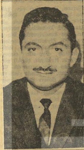
Bülent Ecevit Sıcaklık getirdi

Ecevit'in tartışmalara biraz sıcaklık getiren bu sözleri, plân müzakerelerini belki bundan sonra biraz ıstıyacaktır. Ama bu dahi, plân şevk ve inancının